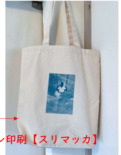
シルクスクリーン印刷【スリマッカ】