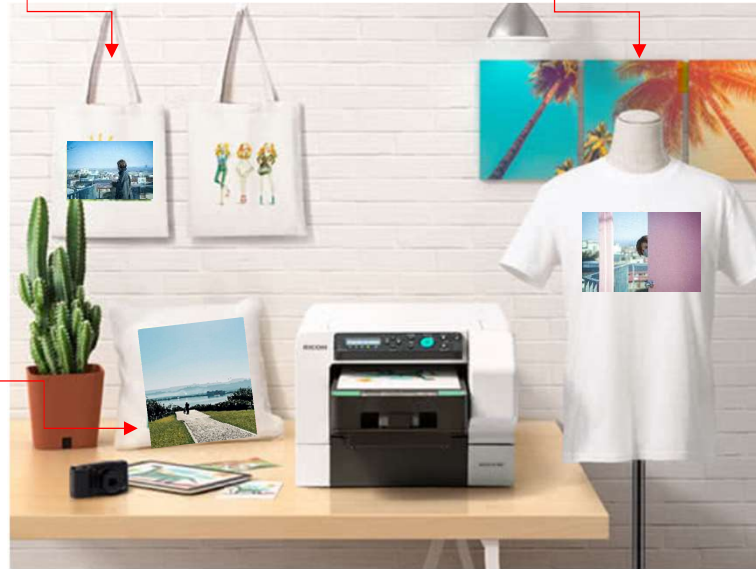
ガーメントプリンター【Ri 100】