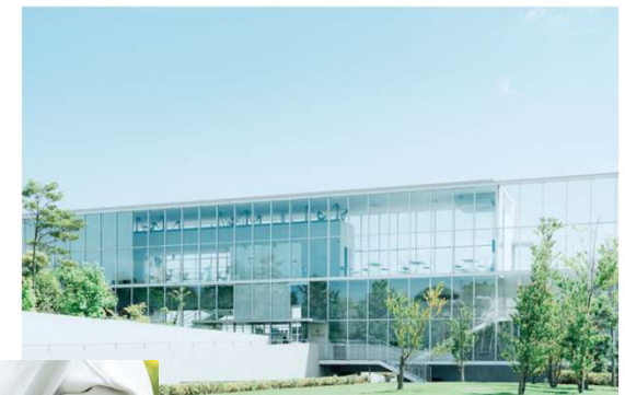
加賀片山津温泉総湯