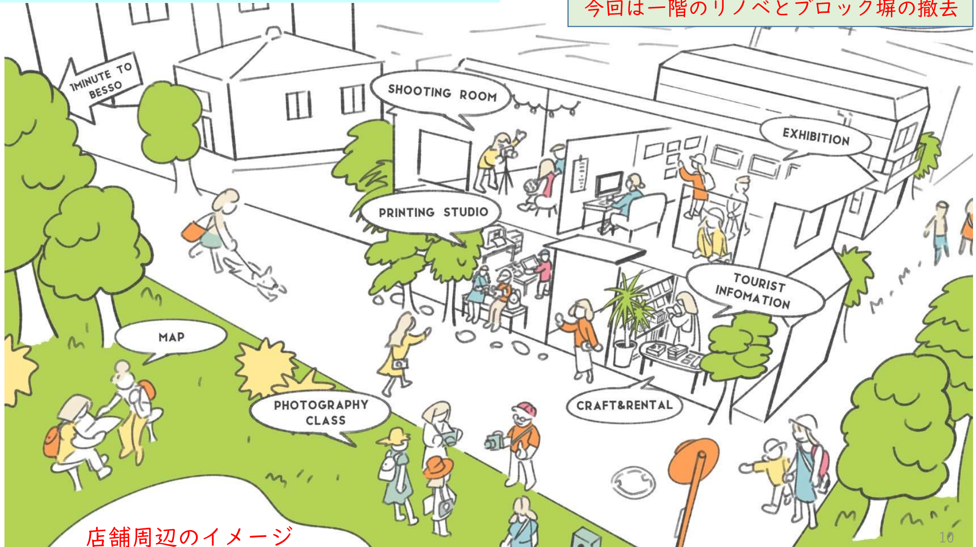
店舗周辺のイメージ